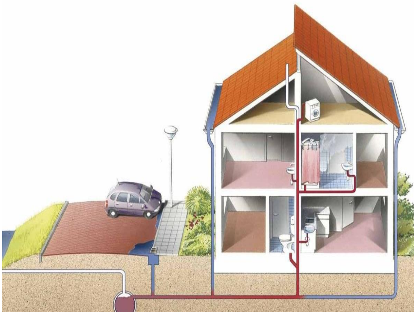
Gemengd rioolstelsel (Paul Maas, Tilburg/Stichting RIONED)

Wanneer de ontlufter op het dak van uw woning niet goed werkt dan zoekt de lucht een andere weg en kan deze via de binnenriolering de woning binnen komen. Controleer daarom de ontlufter op het dak. Het kan voorkomen dat deze dicht zit met bijvoorbeeld bladeren of vogelnestjes.